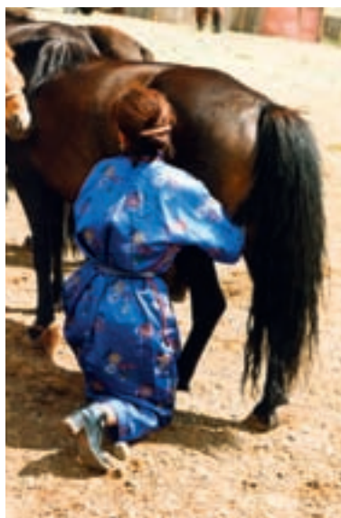
Traite des juments qui servira à produire l'airak, sud Gobi.