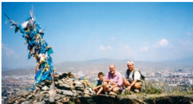
Les trois générations près d'un ovoo surplombant Ulan Bator.

dans cette station thermale où nous logeons en yourte.