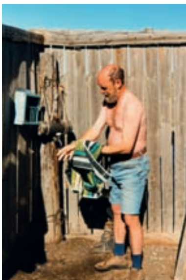
Salle de bains de la cabane de Pépé, sud Gobi.