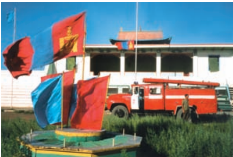
Les pompiers de Dalanzadgad arrosent la piste en vue de la fête du Naadam.

derrière pour m'aider à gravir les très hautes marches. J'ai opté pour une couchette, car il faudra une dizaine d'heures pour effectuer les 300 kilomètres. Le train à peine démarré, une boisson fraîche me tente: il y en a dans le wagon précédant le mien, à côté de l'inévitable samovar. Au moment de régler les quelques tögriks que coûte ma bière chinoise: surprise. Mauvaise surprise: la petite pochette contenant l'équivalent de 50 dollars changés ce matin a disparu de la poche droite de mon short, pourtant fermée par un scratch! Eh oui, c'est la seconde fois que je suis «pick-pocketté» lors de mes périples asiatiques. La première fois était dans un bus au Népal, mais j'avais, par chance ou intuition, pu récupérer le butin. Cette fois, malgré les précautions prises, je me suis fait avoir comme un bleu. Carte Visa, passeport, billets d'avion sont cependant toujours dans une pochette suspendue au cou, sous les vêtements, pochette qui ne me quitte jamais de tout le périple... Une autre précaution est de photocopier ses documents indispensables.