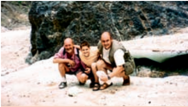
Les trois générations dans la vallée de Yolly An : glaces éternelles en plein Gobi.