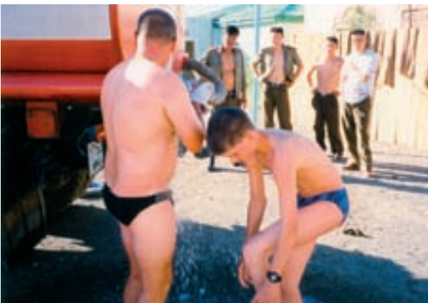
L'autopompe est sortie du garage pour une «douche». Dalanzadgad, sud Gobi.

Bref, nous préférons ce que nous appelons «la lavande» : dans la montagne du Gobi, chez les amis, le petit coin était un ancien oued asséché où fleurissait et fleurait bon la lavande sauvage. Deux bonnes nuits