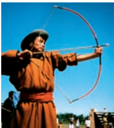
Tir à l'arc lors de la fête du Naadam. Dalanzadgad, sud Gobi.