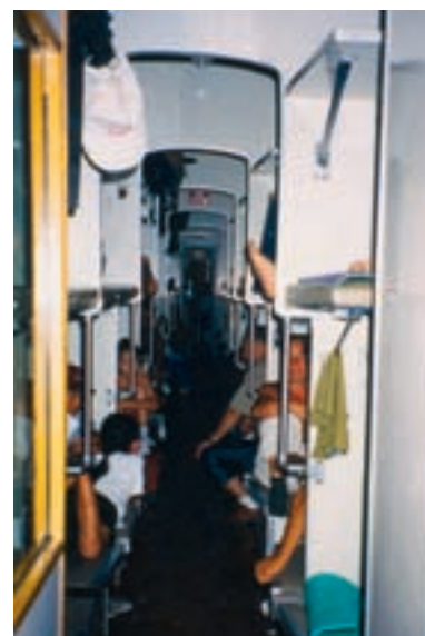
Promiscuité mais contact facile dans un « wagon-lit » du trans-mongolien.