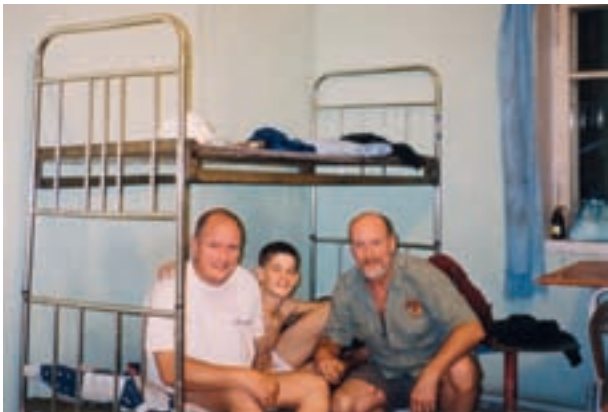
Chambrée de garde du poste 21 des pompiers de Dalanzadgad, sud Gobi.