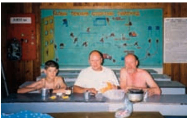
Les trois générations dans la salle de cours du poste 21 à Dalanzadgad, sud Gobi.

Dans la cohue pour accéder aux wagons, un Mongol saisit mon sac à dos et me pousse au