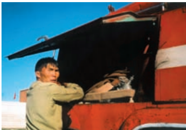
Pompier du poste 21 à Dalanzadgad, sud Gobi.

Notre coup de cœur ira cependant aux courses de chevaux : dans une jeep privée pilotée par un pompier, nous avons la chance d'assister de bout en bout à une de ces courses. Une centaine de gosses, filles et garçons âgés de 6 à 13 ans, partent pour un trajet de quinze kilomètres, vers le point de départ. Le groupe de cavaliers est compact, entouré de dizaines de jeeps, voitures, camions, où sont entassées les familles. Il fait déjà presque canicule et un nuage de poussière jaune cache toute la vue sur les participants. Les gosses montent, qui à cru, qui avec une superbe selle en bois et crient leur fameux «you you» ! Soudain, sans crier gare, les deux adultes qui conduisent la troupe font volte-face : c'est le départ et, en deux ou trois minutes, le peloton des concurrents s'étire déjà. Les véhicules qui accompagnent roulent de chaque côté du peloton, mais