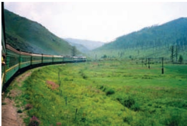
Quelques heures de mythique trans-mongolien, près de la frontière russe.