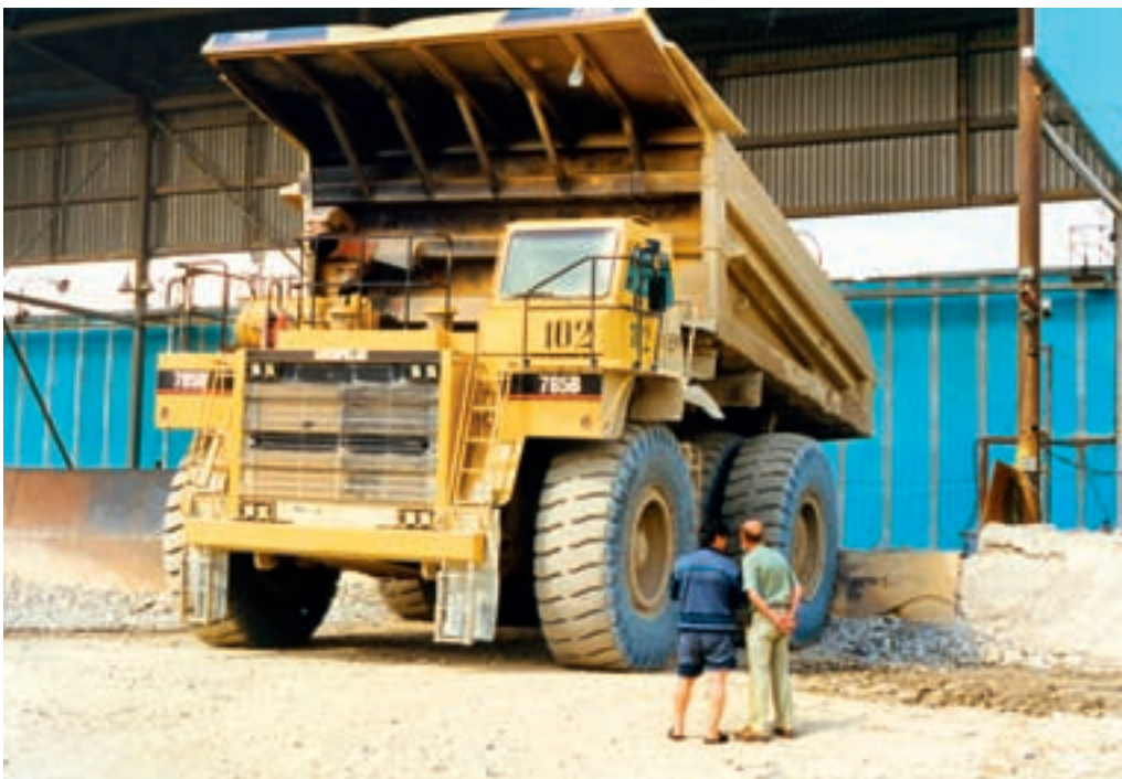
Mines de cuivre à ciel ouvert à Erdenet (nord-ouest d'Ulan Bator).

Avant de reprendre la piste (cet arrêt est en réalité pour demander la protection des dieux pour