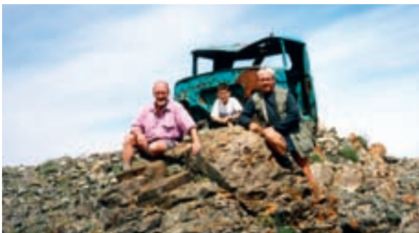
Cabine de camion (ovoo) au faite d'une colline, sud Gobi.