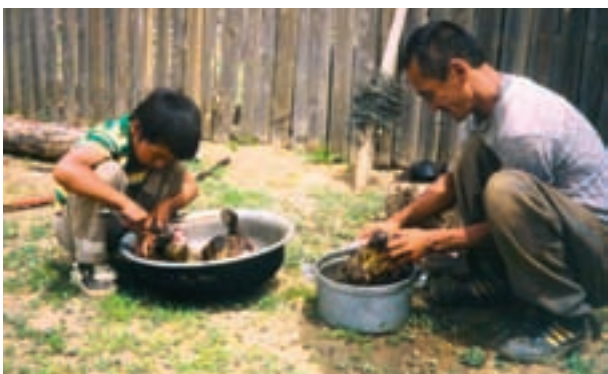
Préparation de tête et estomac de chèvre pour un repas, sud Gobi.